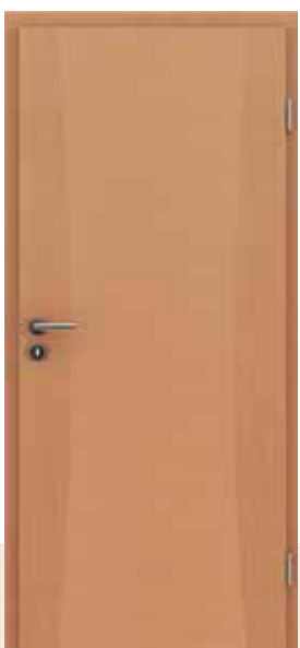
HIGHline / 113 bukva