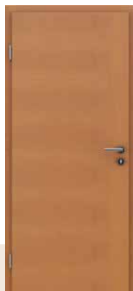
HIGHline / I14 joha tonirana