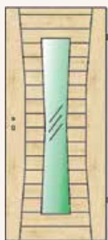
model I13 LA