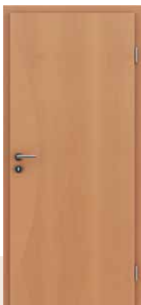
HIGHline / 13 bukva umetak od bukve

Na prvi pogled slična vrata razlikuju se u strukturi furnira, intarzija i ističu se u kombinacijama različitih vrsta domaćih i egzotičnih vrsta drveta.