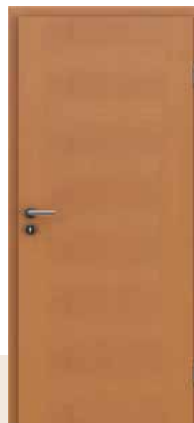
HIGHline / 113 joha tonirana