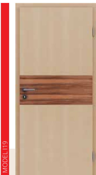
HIGHline / I19 javor umetak od indijske jabuke

Danas pomoću te tehnike, utemeljene na dugogodišnjim iskustvima stručnjaka, proizvodimo naše proizvode.