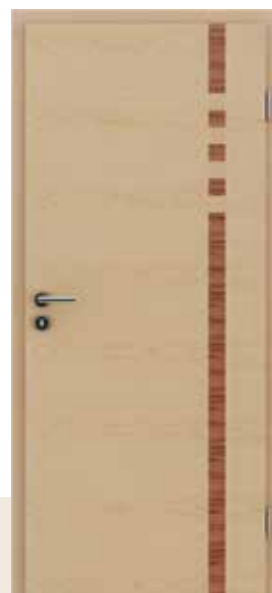
HIGHline / I17 javor umetak od indijske jabuke, javor