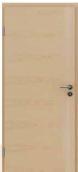
HIGHline / I14 javor