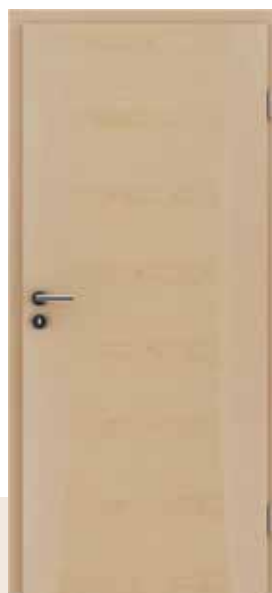
HIGHline / 113 javor