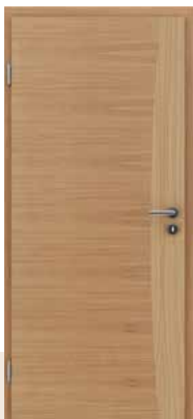
HIGHline / I14 europski hrast