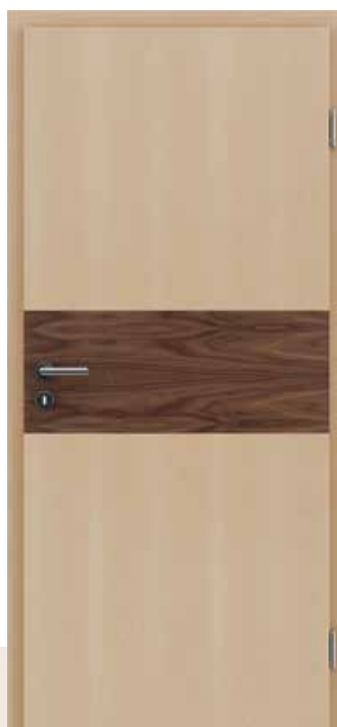
HIGHline / I19 javor umetak od oraha