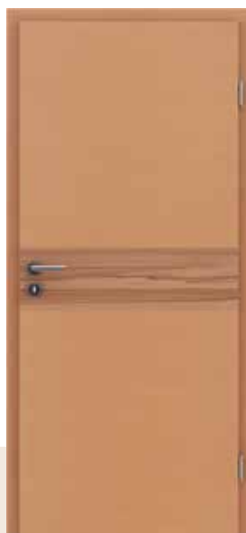
HIGHline / I16 bukva umetak od srčike bukve