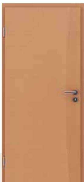
HIGHline / I14 bukva