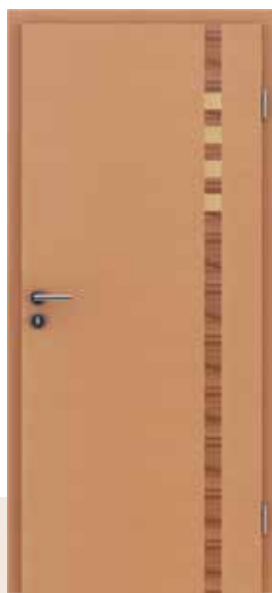
HIGHline / I17 bukva umetak od indijske jabuke, javor