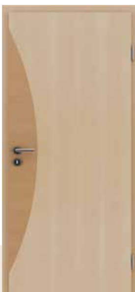
HIGHline / 13 javor joha umetak