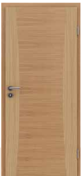
HIGHline / 113 europski hrast